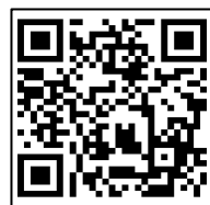
栃木市医療・介護・地域資源総合検索サイト